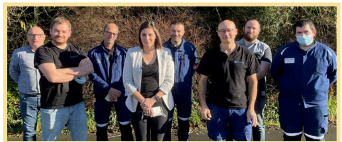
- MEMBRES DU CSE

Environ 15% de l'effectif de 60 personnes est impliqué dans les sujets de sécurité.