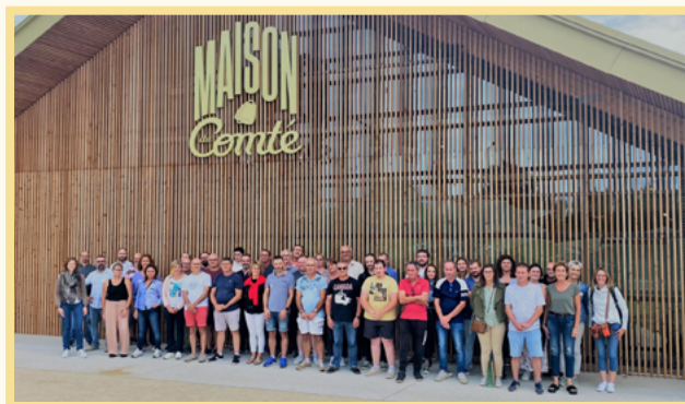
- SERVI DORYL À LA MAISON DU COMTÉ

Au programme de ces 2 jours en Franche-Comté : visite de la Fruitière Rix-Trebief et découverte des procédés de fabrication de fromages à pâte pressée, parcours au cœur des caves d'affinage Fromagerie Marcel Petite du Fort Saint-Antoine, découverte des secrets de l'affinage lent et rencontre avec un Maître Caviste, visite immersive et ludique de la Maison du Comté ; dégustation de fromages et produits franc-comtois.