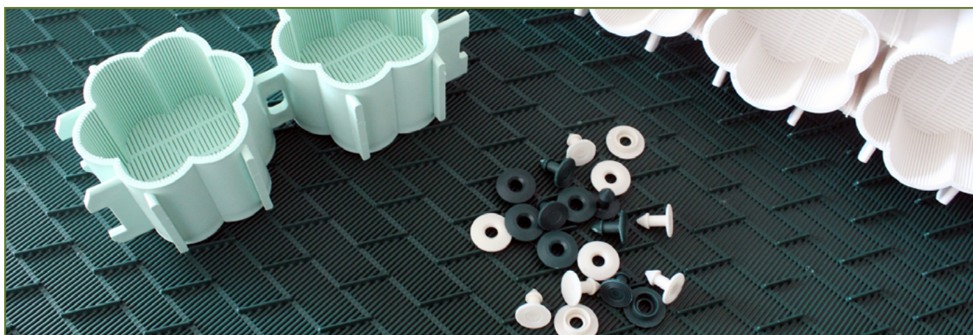
- PRODUITS CONÇUS EN MATIÈRE DÉTECTABLE RX

Nous poursuivons la promotion et l'amélioration des matières détectables aux détecteurs de métaux ou détecteurs RX . La gamme des stores d'égouttage a été étoffée avec ces matières. De plus, une étude a été lancée sur une gamme de produits bleus pour la sécurité alimentaire dans les ateliers de nos clients.