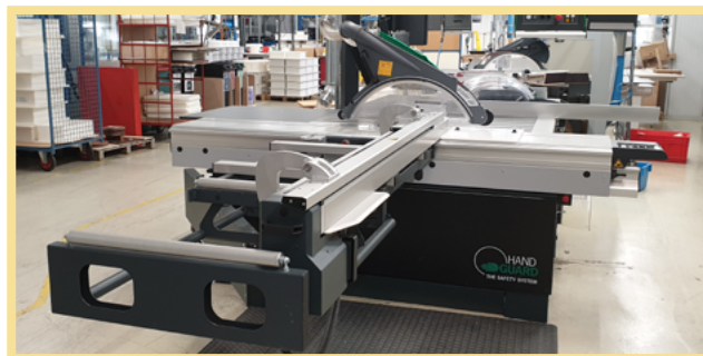
- SCIE CIRCULAIRE HAUTEMENT SÉCURISÉE

Le plan d'investissements de Servi Doryl comprend chaque année des réflexions sur les équipements critiques, mais également sur les accessoires de production facilitant les transferts sans ports de charge, et visant à limiter les déplacements inutiles et réduire les TMS. Ces actions sont menées avec le CSE.