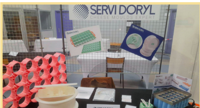
- SERVI DORYL AU FORUM PROJECTION 3E

Au programme : conférences, tables rondes et jobdating. Cela a été une belle occasion de rencontrer des jeunes au plus près de nos besoins et de les confronter aux codes de la recherche d'emploi.