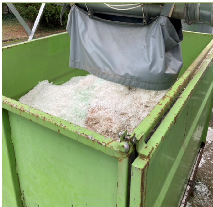
- BENNE COPEAUX

Nous avons également investi dans un nouveau silo. Cet achat devrait nous permettre de poursuivre nos actions.