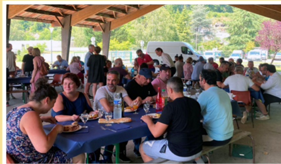
- LE BARBECUE SERVI DORYL

En juin, toute l'équipe Servi Doryl s'est retrouvée autour d'un barbecue. De la chaleur et surtout de la bonne humeur étaient au rendez-vous pour partager ce moment de convivialité et de cohésion d'équipe .