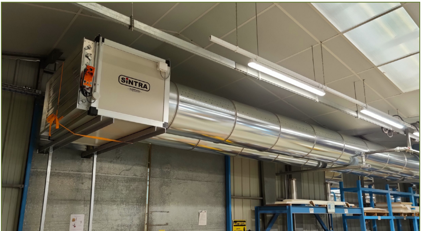
- CLIMATISATION RÉVERSIBLE